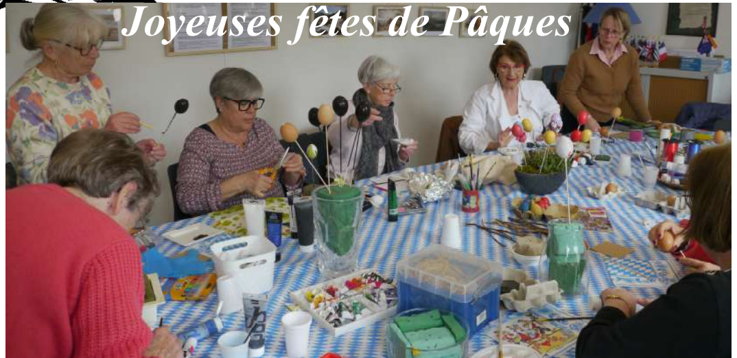
L'atelier de fabrication des œufs de Pâques Ostereier à la Maison des Jumelages